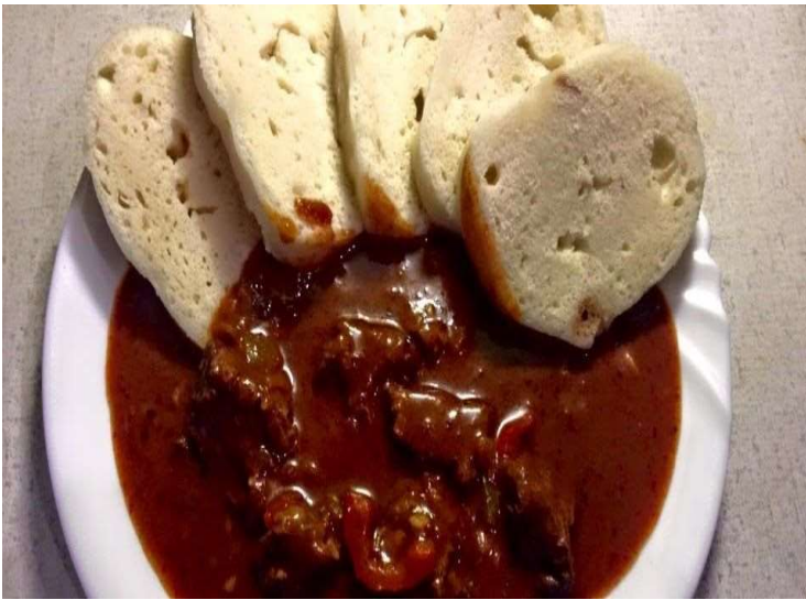
Jelení guláš, houskový knedlík