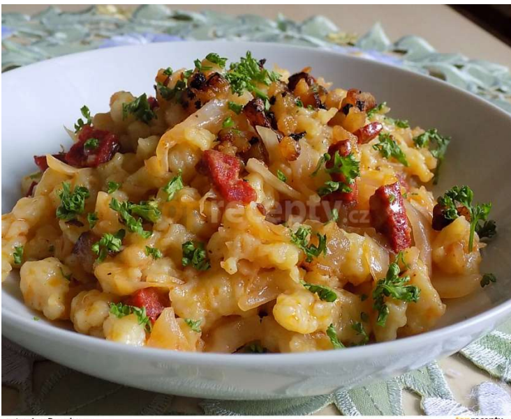
Uzená krkovice, halušky, zelí