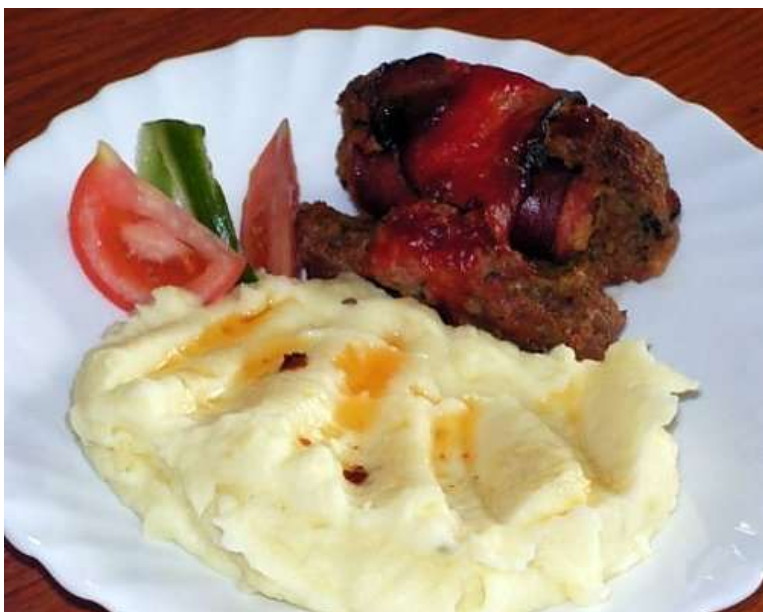
Luhačovický špalek, br. kaše, okurka