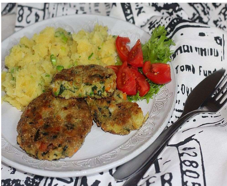
Brokolicové řízečky, vařené brambory, salát