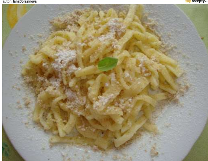
Nudle s tvarohem