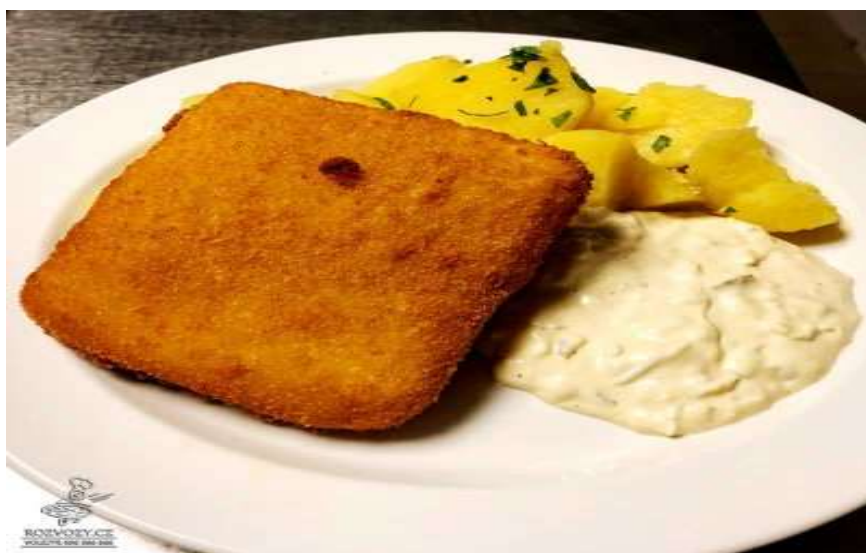
Smažený sýr, brambory, tatarská omáčka