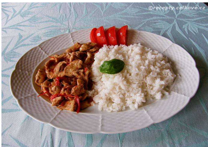
Kuřecí maso na bazalce, rýže