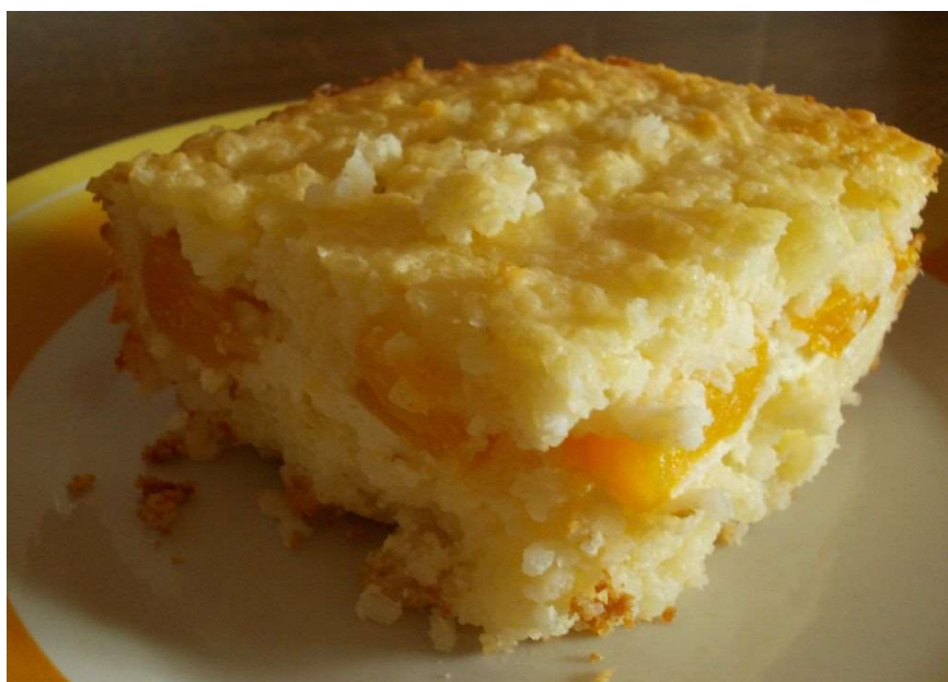
Rýžový nákyp s ovocem