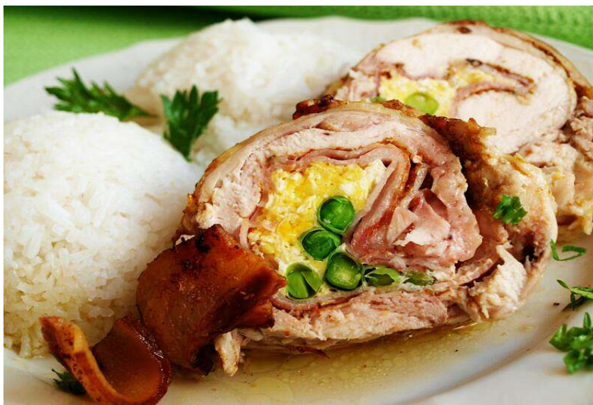
Plněná roláda, rýže, salát