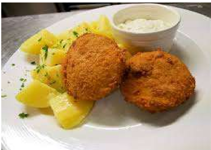
Smažený hermelín, brambory, tatarská omáčka