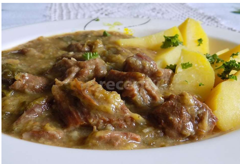
Hovězí maso v kapustě, brambory