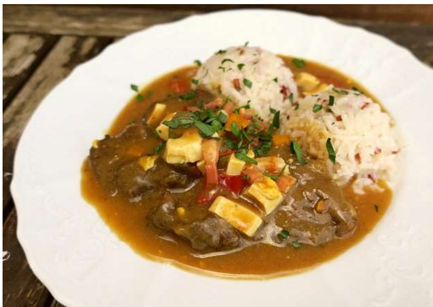
Rozstřelený španělský ptáček, rýže