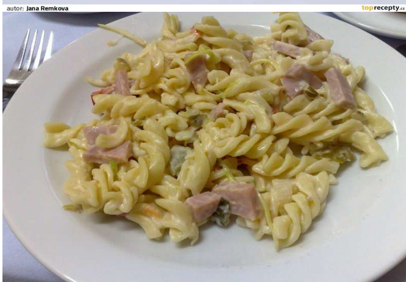
Těstovinová salát se šunkou a sýrem