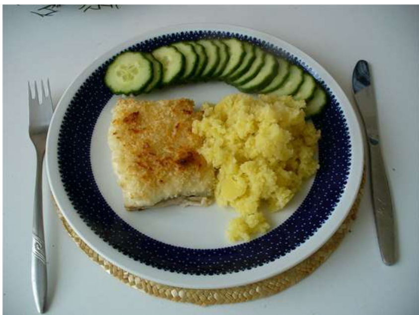
Treska, šťouchané brambory, salát