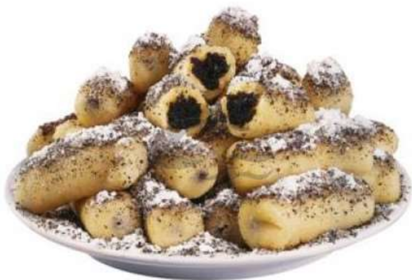
Plněné bramborové šišky s mákem, cukr, máslo