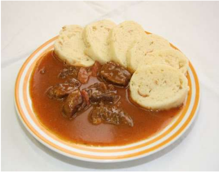
Cikánská pečeně, houskový knedlík