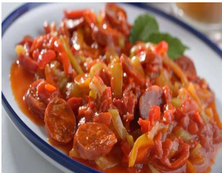
Lečo s klobásou, chléb