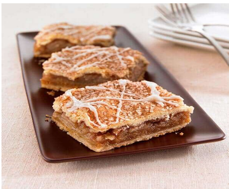
Skořicové řezy s jablky