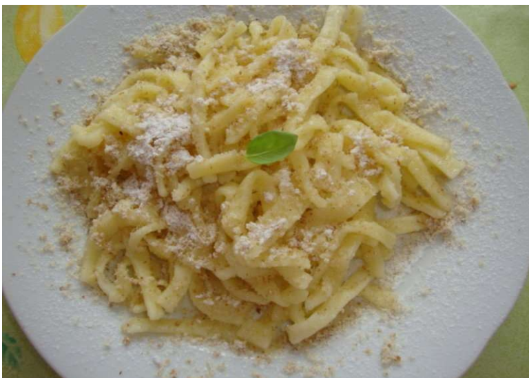
Nudle s tvarohem a cukrem, kompot