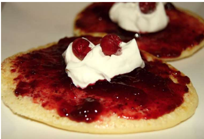
Lívance s marmeládou