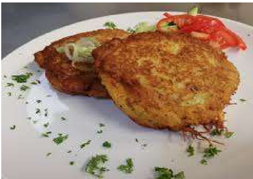
Hermelín v bramboráku, zelný salát