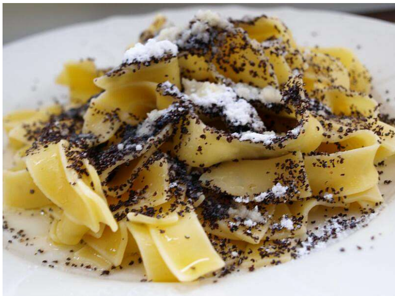
Nudle s mákem, kompot