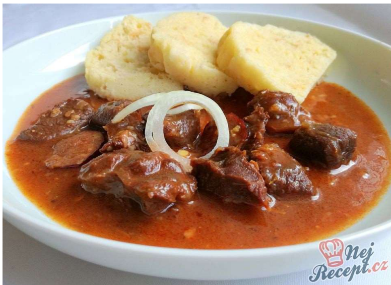
Hovězí guláš, houskový knedlík