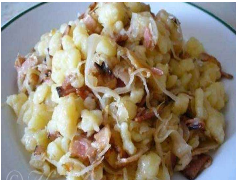
Halušky s uzeným masem, zelí