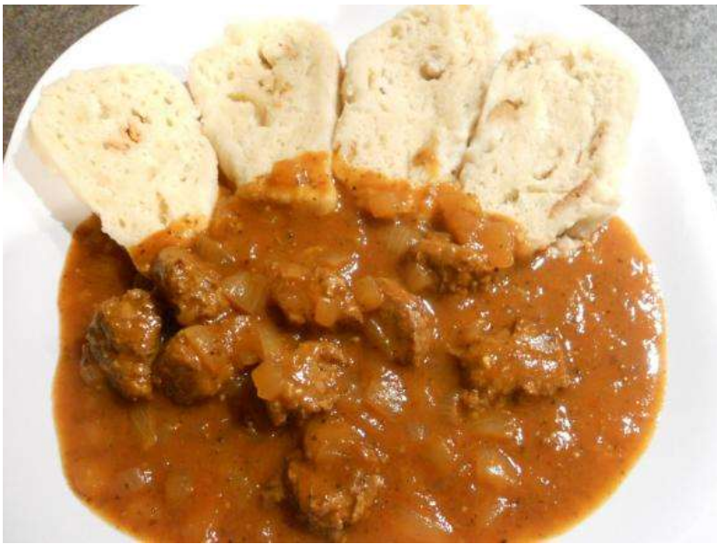
Segedínský guláš, houskový knedlík