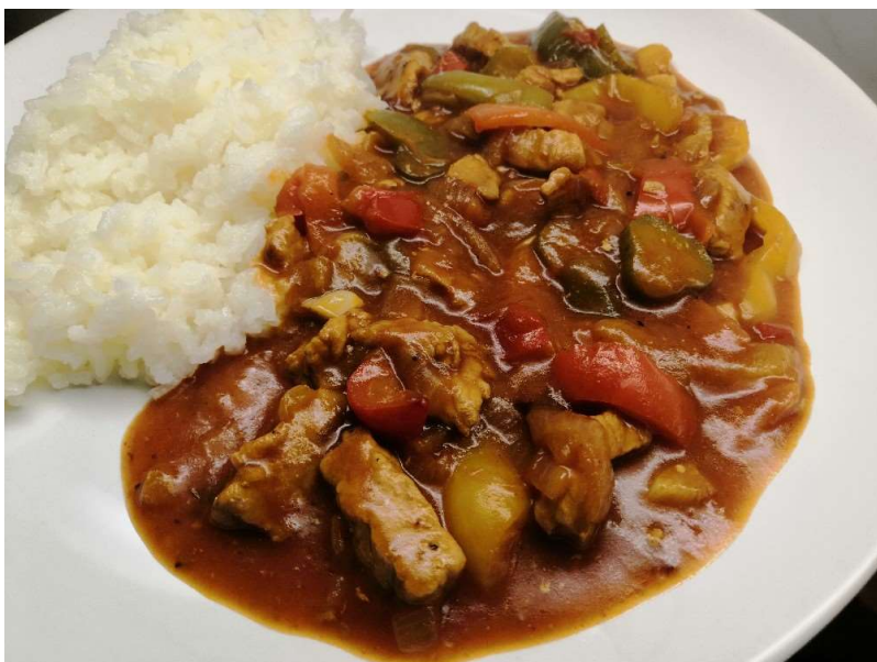
Katův šleh, rýže