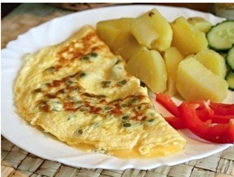
Vaječná omeleta s mozzarellou, brambory, okurka