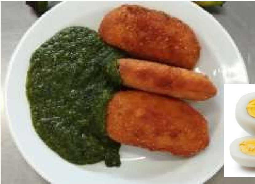
Špenát, bramborové krokety, 2ks vejce