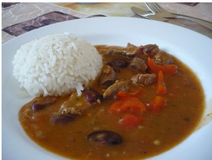
Domažlické ragů, rýže