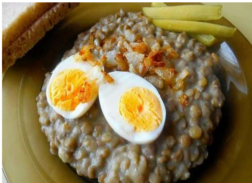
Čočka na kyselo, 2 ks vejce, chléb