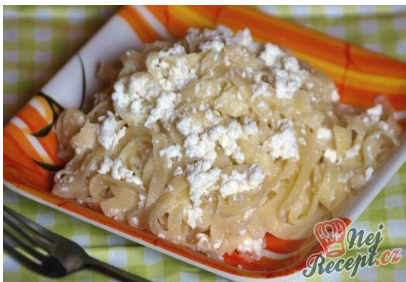
Nudle s tvarohem, kompot