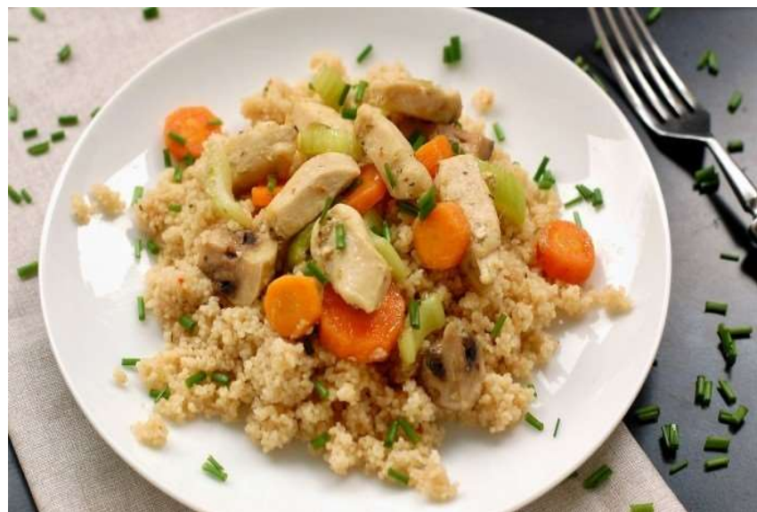
Kuskus s kuřecím masem, salát