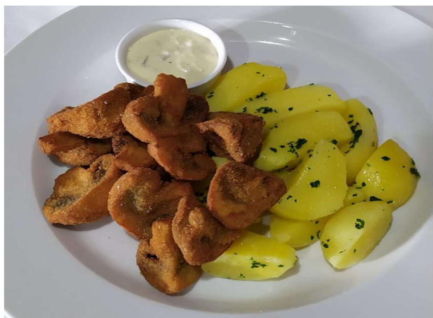
Smažené žampiony, brambor, tatarská omáčka