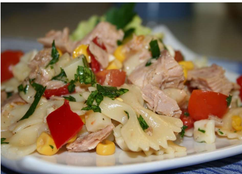
Těstovinový salát s tuňákem, pečivo