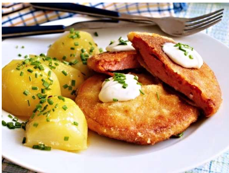
Salám v těstíčku, brambor, okurka