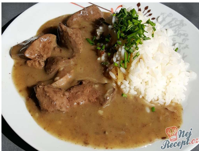
Játra na cibulce, rýže