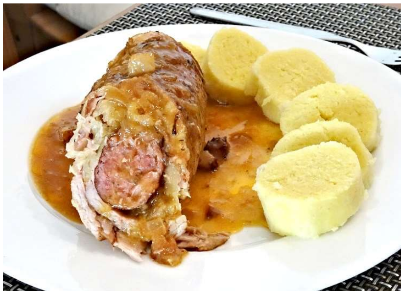
Záhorácký závitek, bramborový knedlík