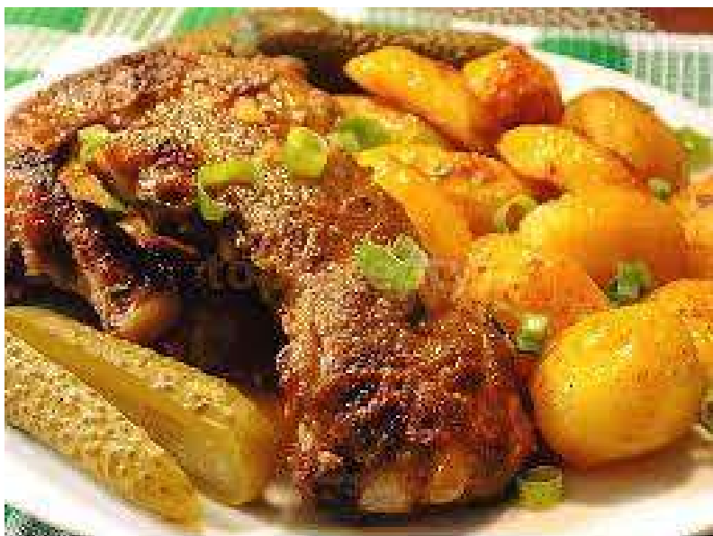
Žebírko Herkules, brambor, okurka