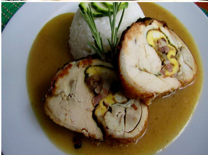
Kuřecí roláda, rýže, salát