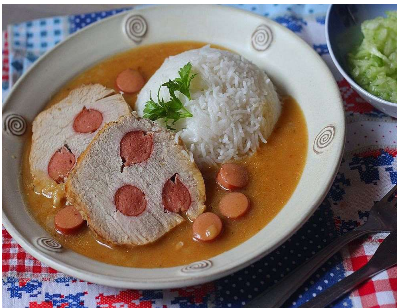
Frankfurtská vepřová kýta, houskový knedlík