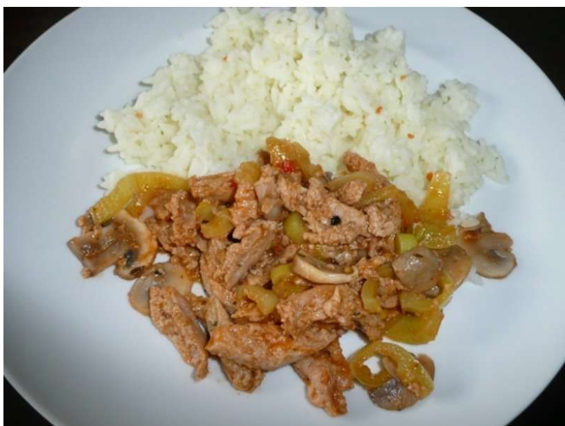
Soja na kari, rýže