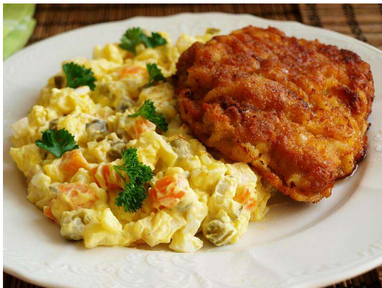
Smažený vepřový řízek, bramborový salát