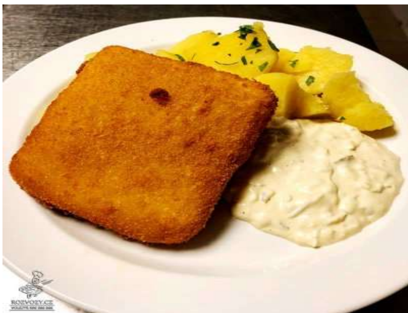
Smažený sýr, brambor, tatarská omáčka