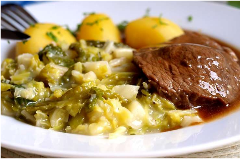
Hovězí maso v kapustě, brambor