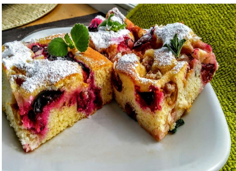
Bublanina s ovocem