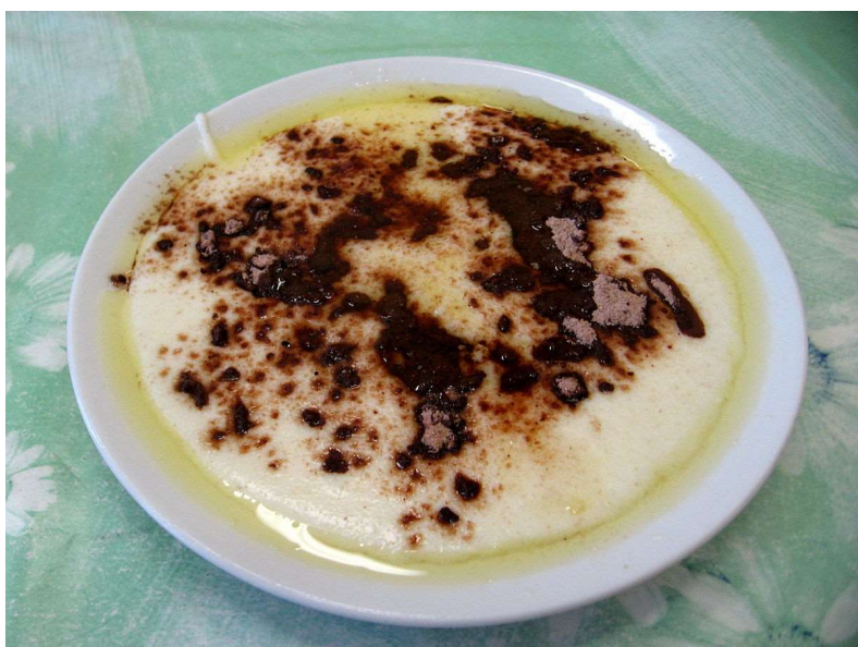
Krupičná kaše s grankem, kompot