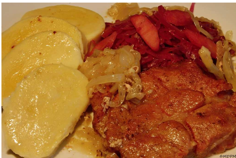
Pečený bůček na zelenině, bramborový knedlík