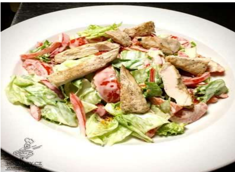
Zeleninový salát s kuřecím masem, dressing