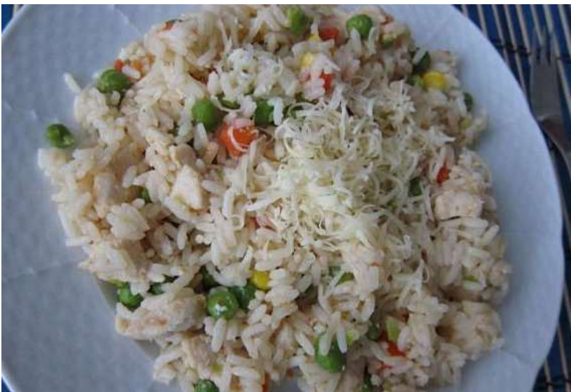
Smetanové kuřecí rizoto, okurka