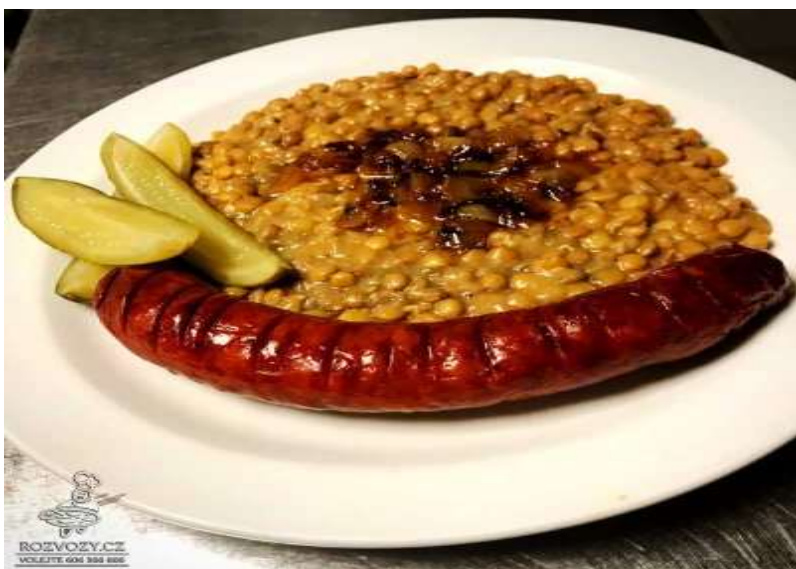
Čočka na kyselo, opečená uzenina, chléb, okurka