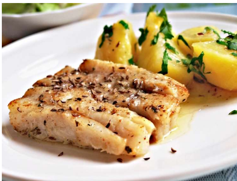
Rybí filé na kmíně, bylinkové brambory, salát