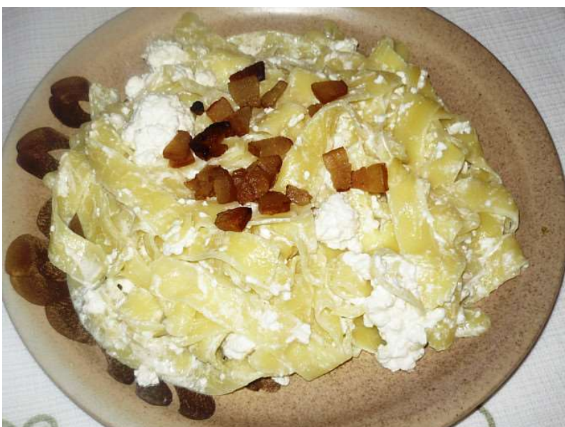
Nudle s tvarohem, kompot