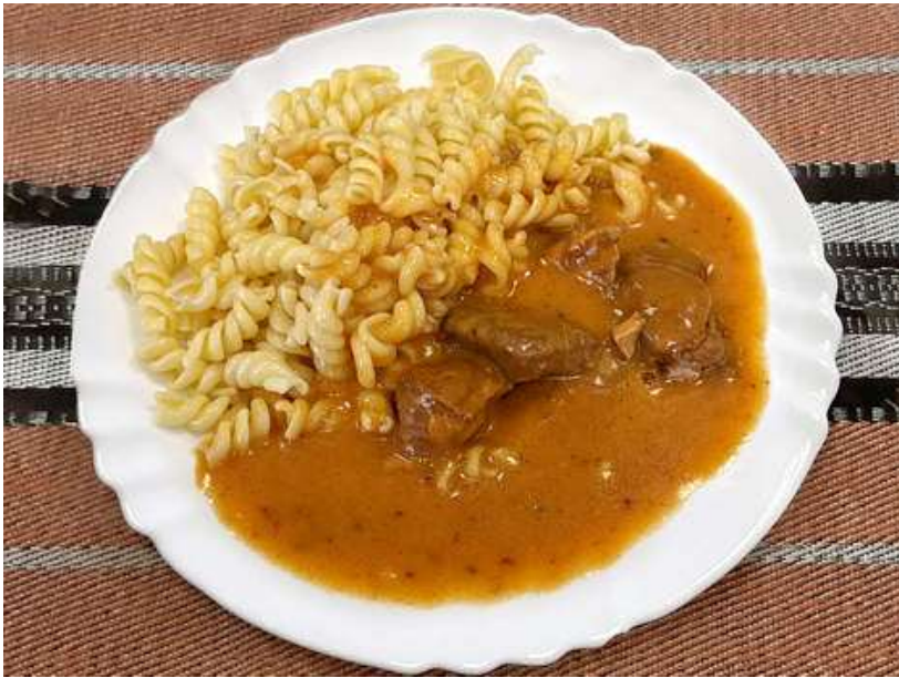
Frankfurtská kýta, těstoviny