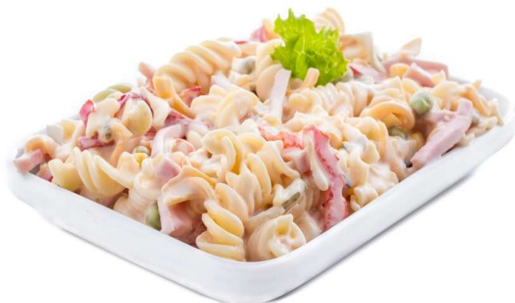
Těstovinový salát se šunkou a sýrem, pečivo