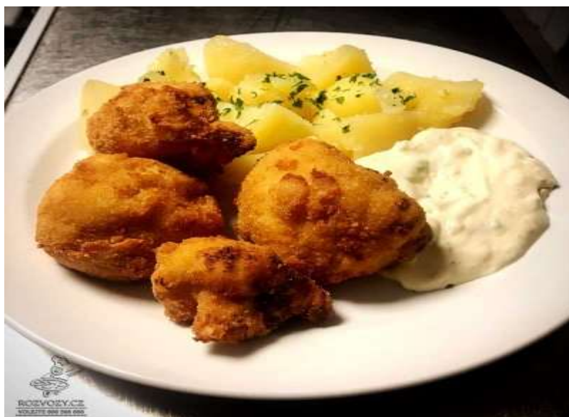
Smažený květák, brambor, tatarská omáčka