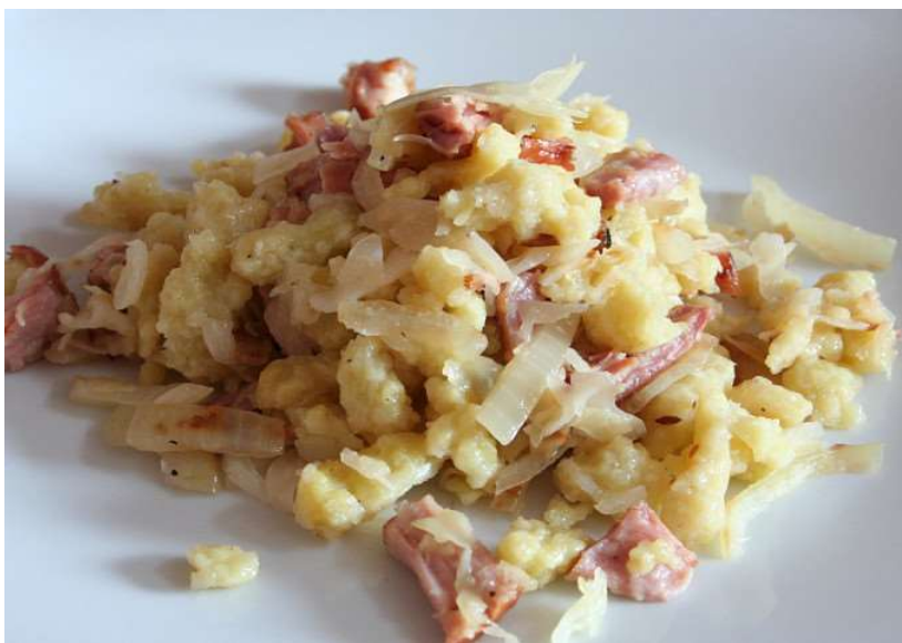
Uzená krkovička, halušky, zelí