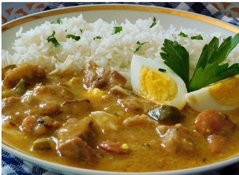
Rozstřelený španělský ptáček, rýže