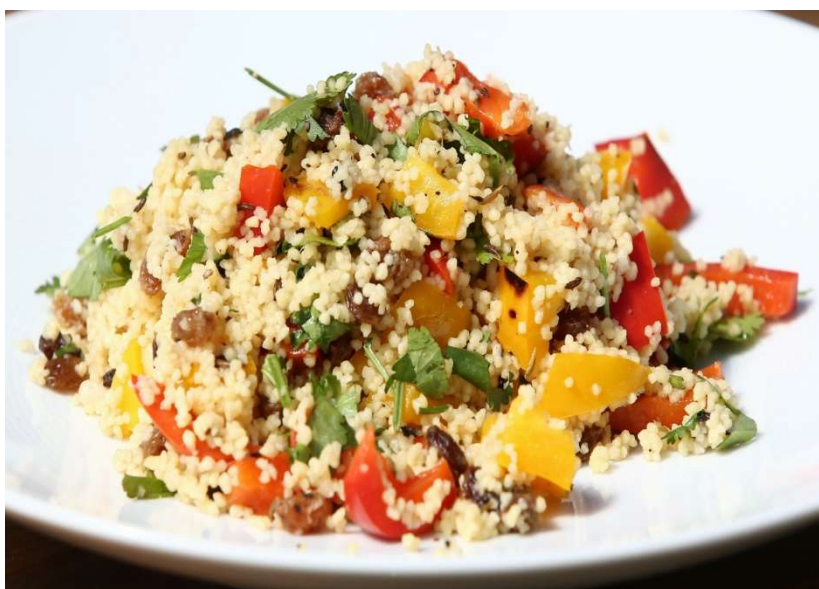
Kuskus s ovocem a rozinkami