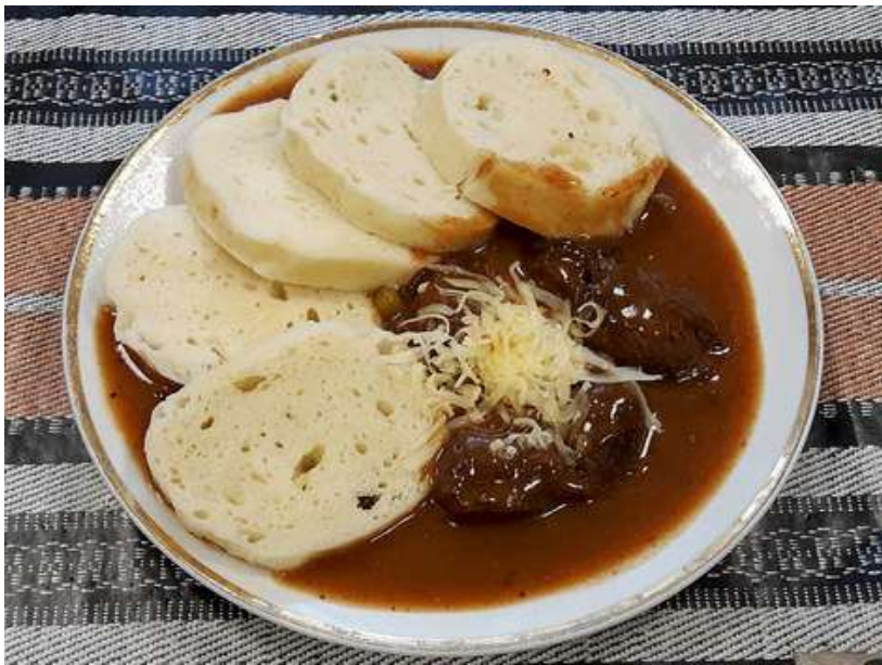
Mexický guláš, houskový knedlík