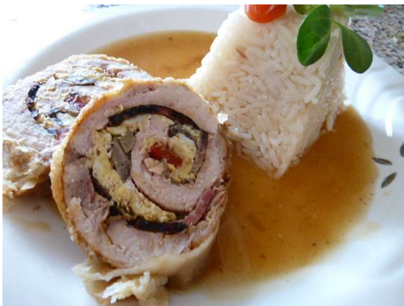
Kuřecí roláda, rýže, salát