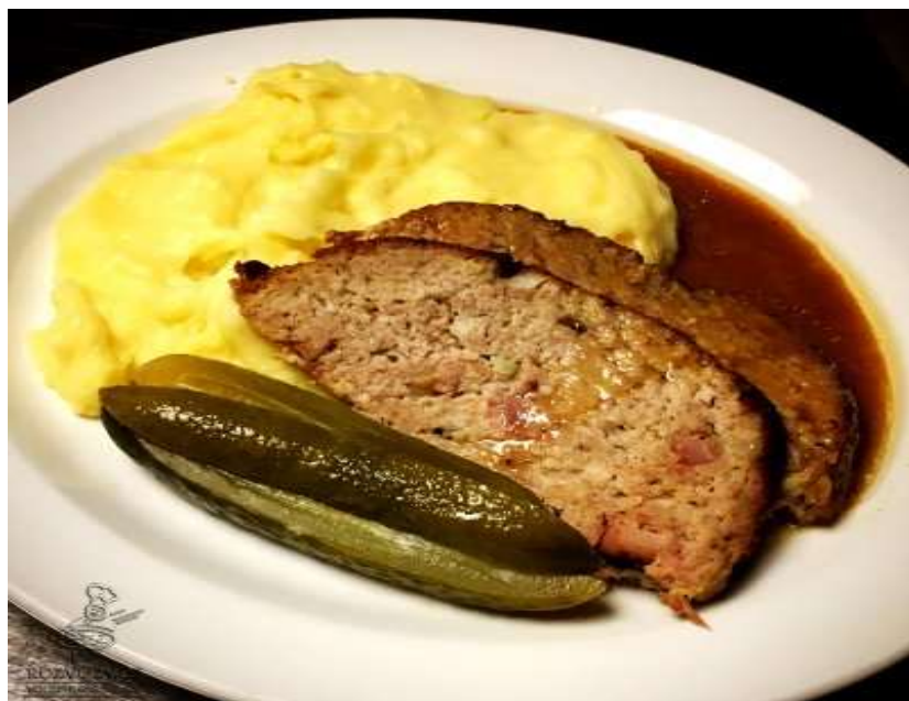
Sekaná, bramborová kaše, okurka