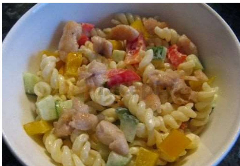
Těstovinový salát s kuřecím masem