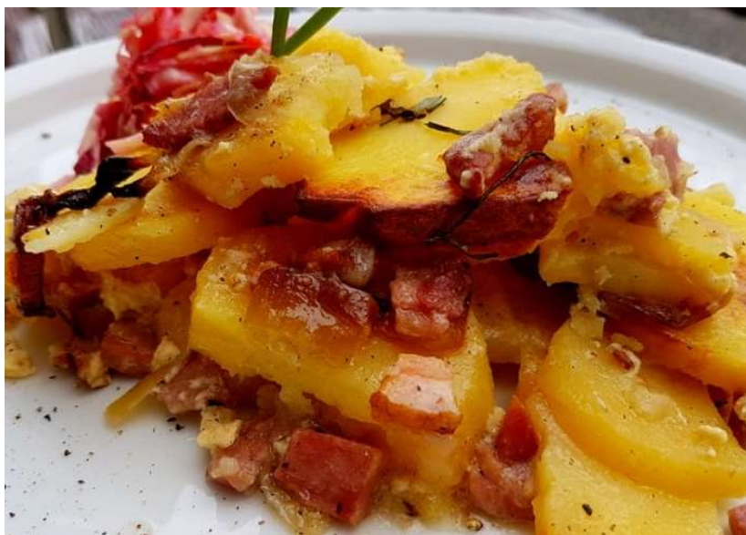
Francouzské brambory, červená řepa