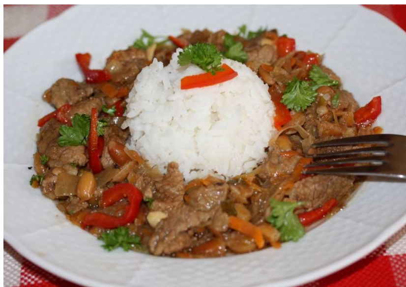
Masová směs Žabák, rýže