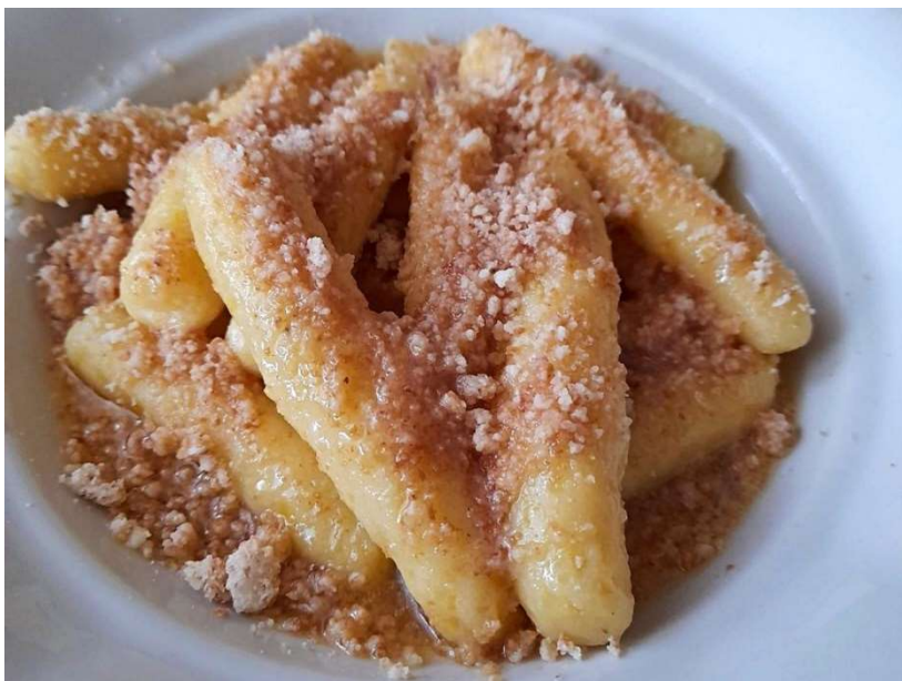
Bramborové šišky se strouhankou, kompot