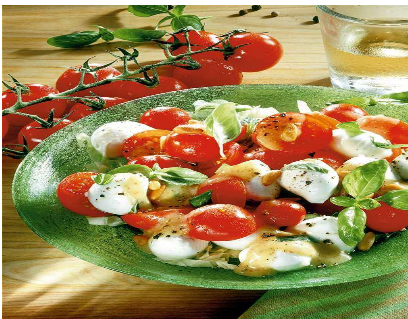
Rajčatový salát s kukuřicí a mozzarellou, pečivo