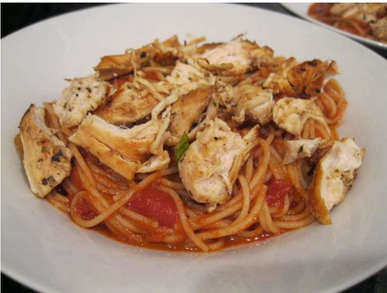
Labužnické špagety s kuřecím masem