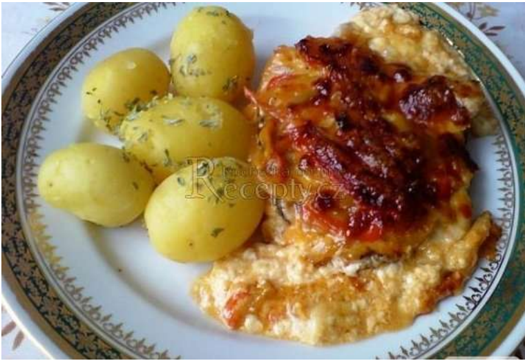
Zapečené žebírko s lečem a sýrem, brambor, okurka