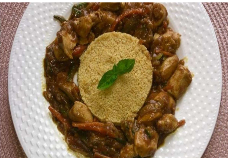
Sójové kostky na kari, kuskus