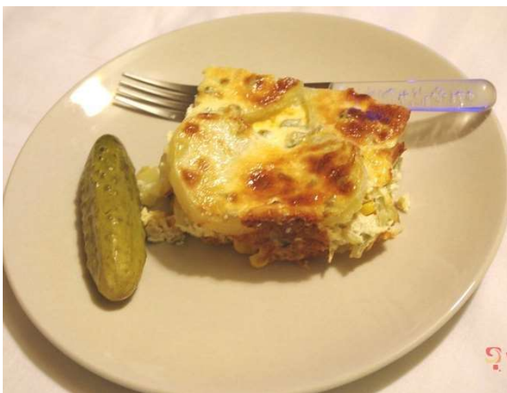
Zapečený květák se šunkou, brambor, okurka