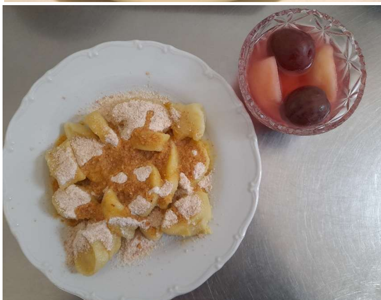
Bramborové šišky se strouhankou, kompot