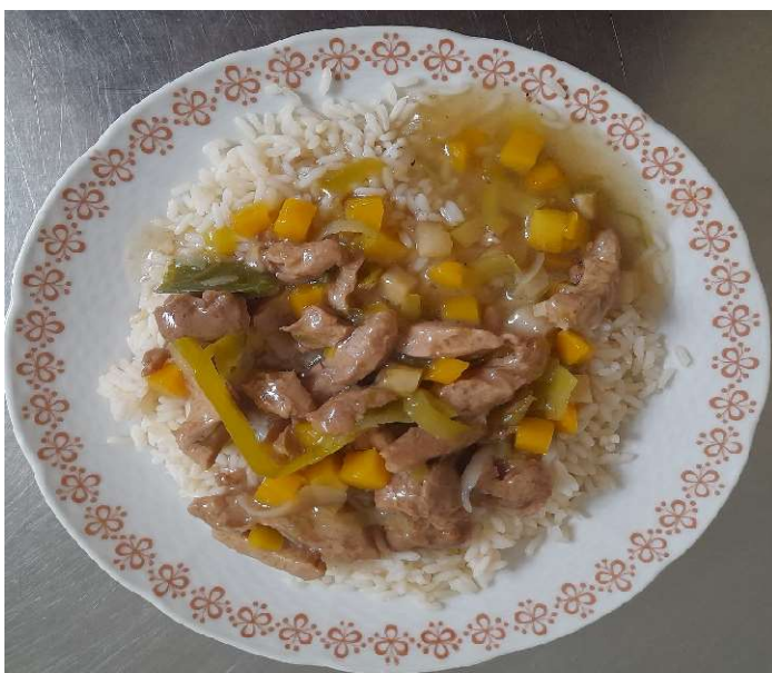
Sojové nudličky na zelenině, rýže