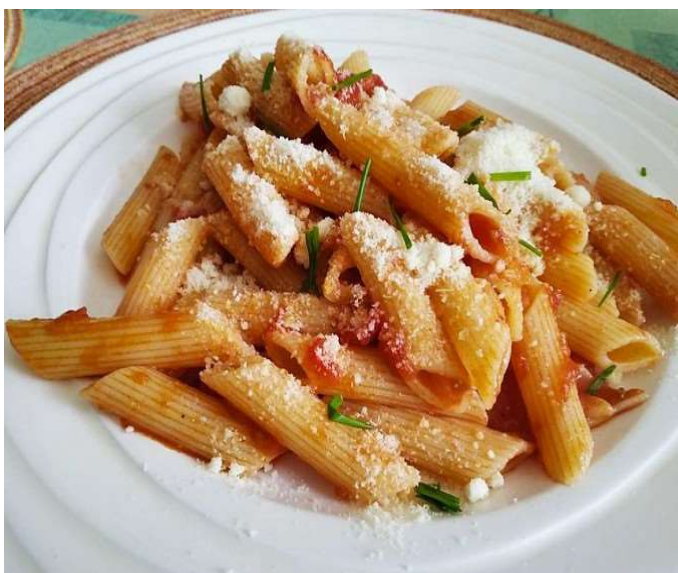
Penne s rajčatovou omáčkou a bazalkou sypané sýrem