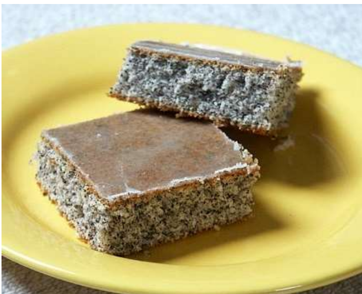
Makovec s polevou