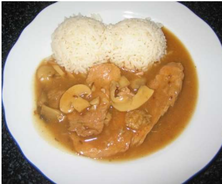
Vepřové žebírko na žampionech, rýže