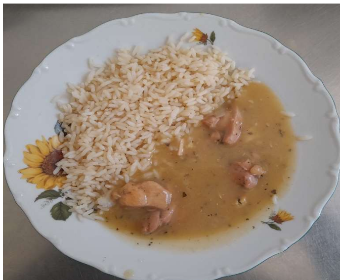
Kuřecí maso na bazalce, rýže