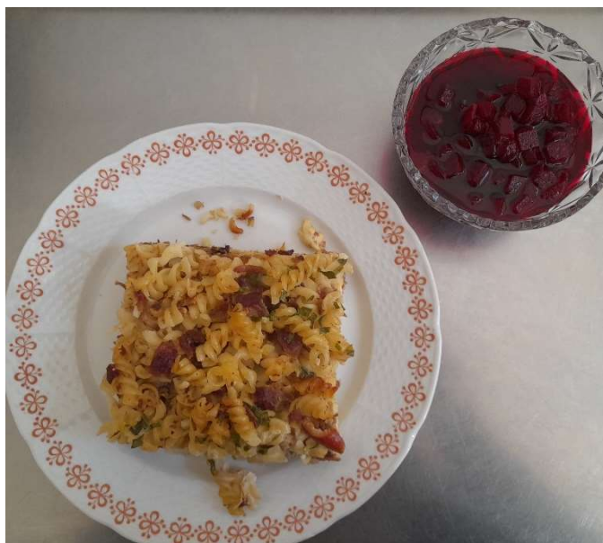
Zapečené těstoviny s uzeným masem, červená řepa