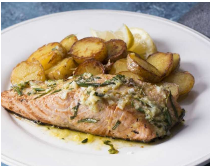
Grilovaný losos, bylinkové brambory, salát