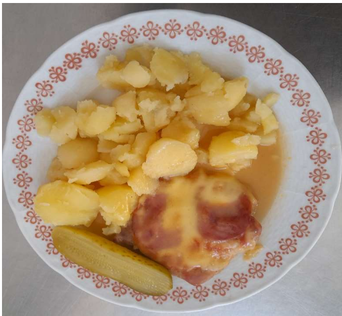
Žebírko Herkules, brambor, okurka