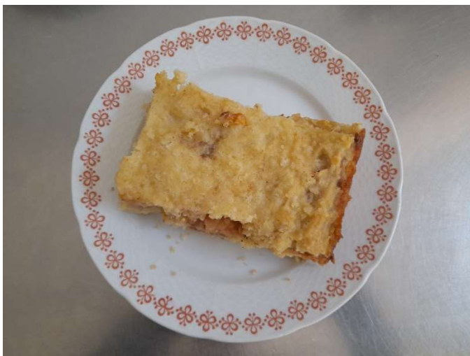
Jáhlový nákyp s ovocem