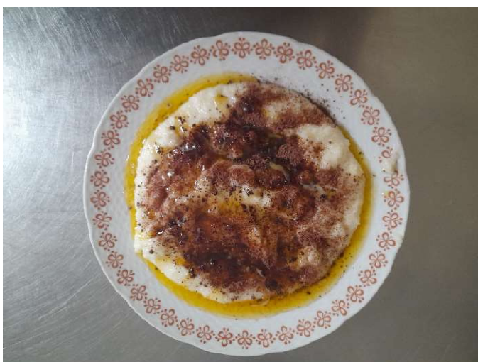
Krupičná kaše sypaná grankem, kompot