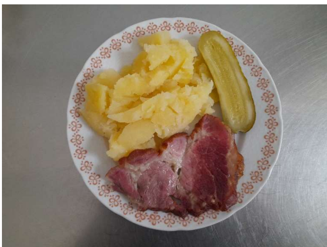
Uzená krkovice, brambor, okurka