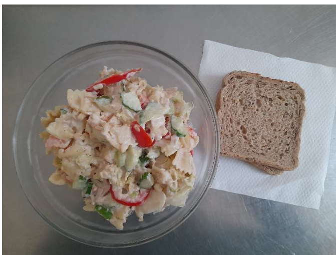
Těstovinový salát s tuňákem, pečivo