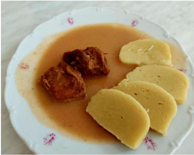
Vepřové kolínko na pivu, bramborový knedlík