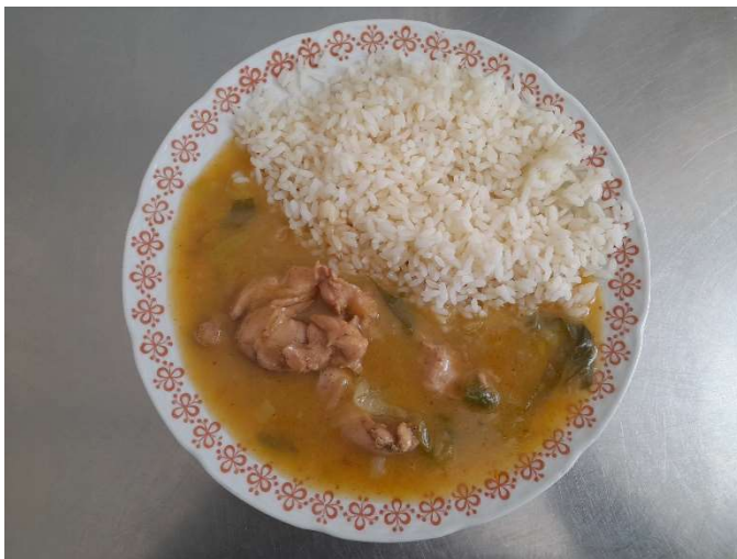
Kuřecí směs na pórku, rýže