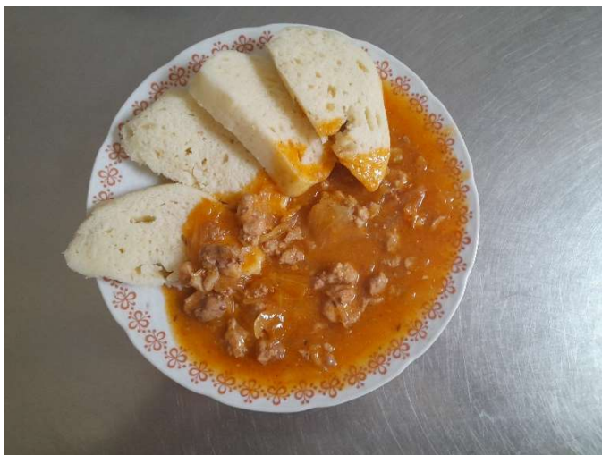
Segedínský guláš, houskový knedlík