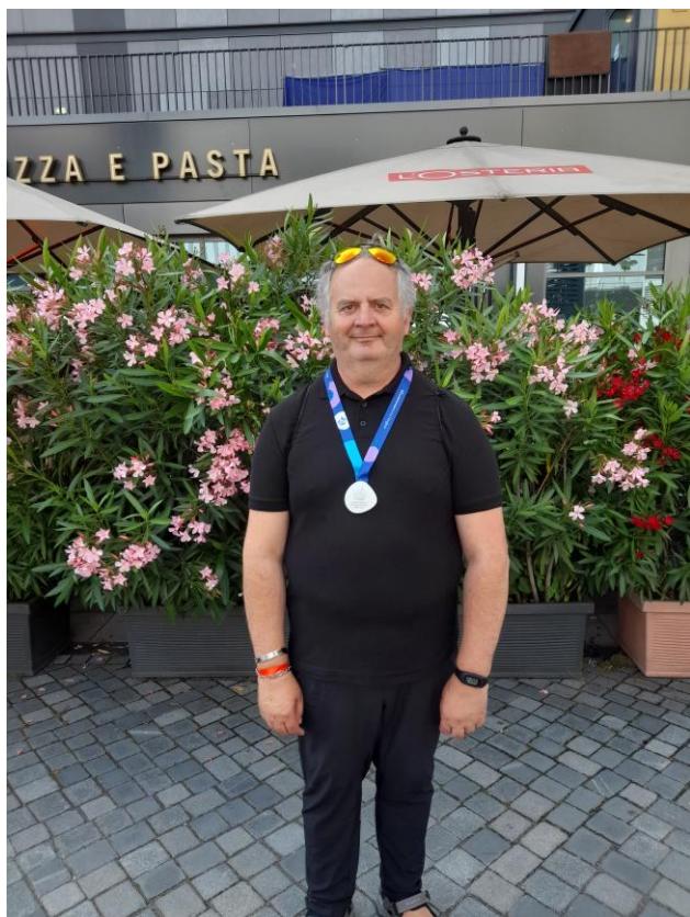
Medailisté z Letních světových her Speciálních olympiád v Berlíně