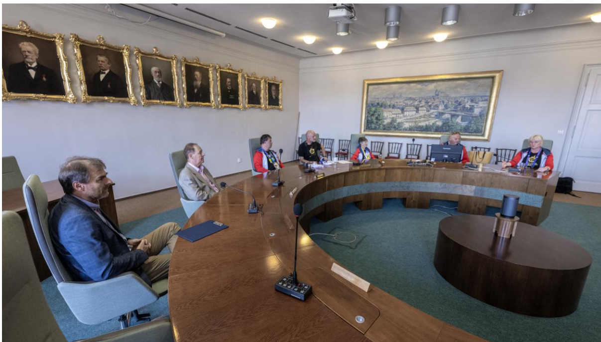
Přijetí olympioniků z Berlína na jihlavské radnici