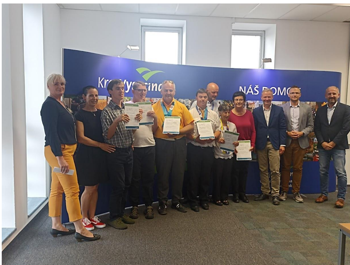
Přijetí sportovců z Emil Open na Krajském úřadě Kraje Vysočina