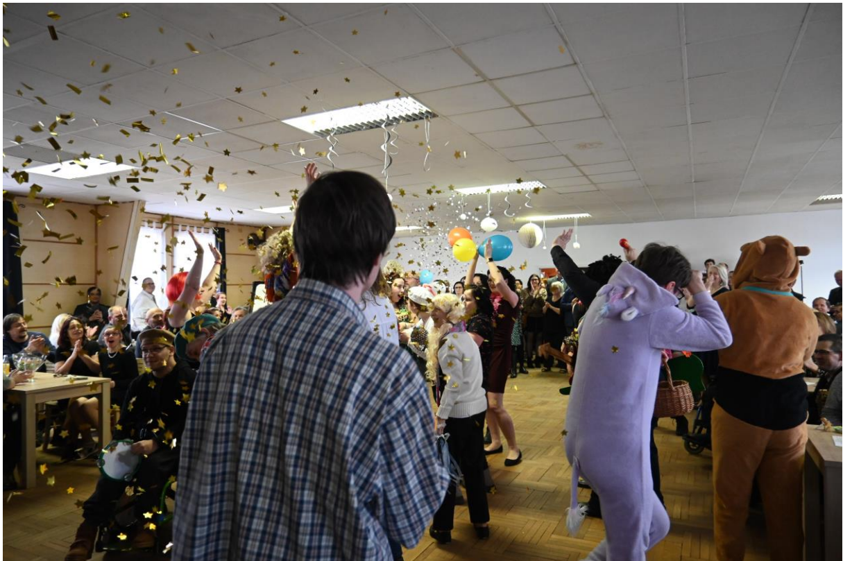
30. ples DTS Jihlava