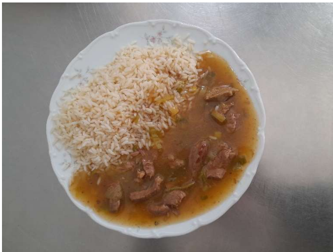
Hovězí nudličky na pepři, rýže