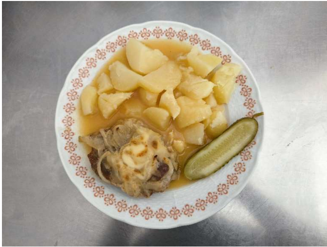
Farářovo tajemství, brambor, okurka