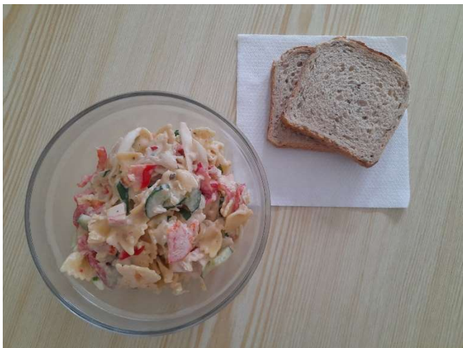
Těstovinový salát s krabím masem, pečivo