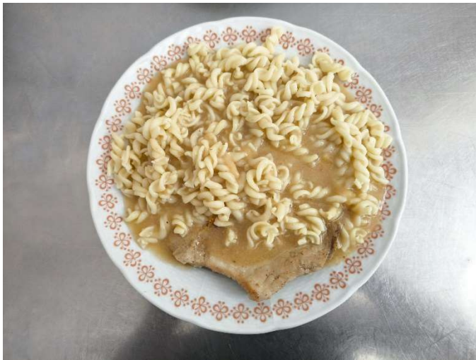
Vepřové žebírko na kmíně, těstoviny