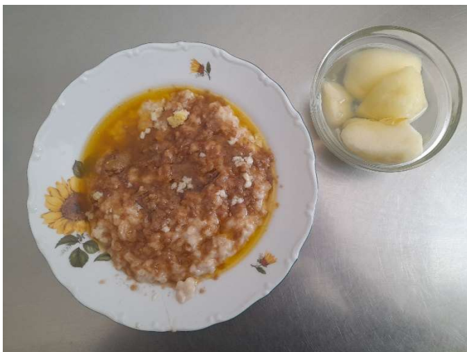
Ovesná kaše s vlašskými ořechy, kompot