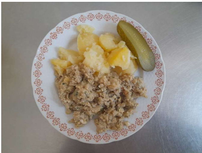
Květák na mozeček, brambor, okurka